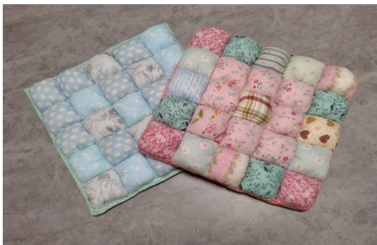
完成したパフクッション

定期的におしゃべりサロンという自由な集まりを開催し、チクチク針仕事をしながらおしゃべりしています。(参加費無料&おしゃべりだけの参加も大歓迎)